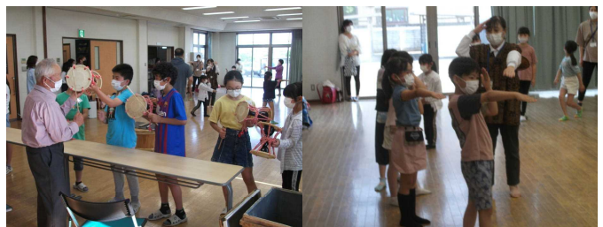
《 八木節の様子 》

今年度、殖蓮公民館で放課後子供教室が開催されています。地域の方々に講師や支援員としてご協力をいただき、希望者30人が第2・第4火曜日の15:40~16:40に英語、中国語、八木節を順番に教えてもらいます。参加している子供たちは楽しそうに活動していました。地域と連携して子供たちを育てていただいていることに感謝です。年間20回の予定です。