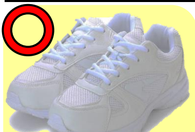
ランニングシューズ型