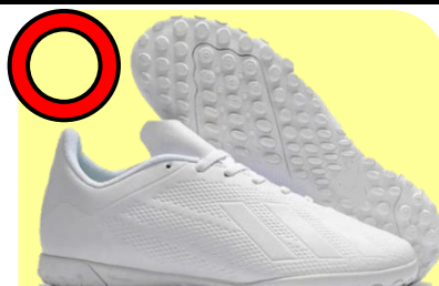
フットサルシューズ型