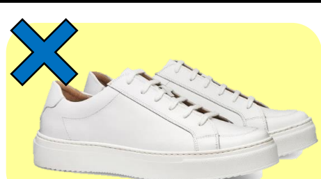
デッキシューズ型