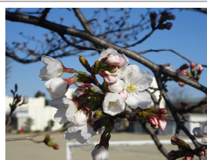
【咲き始めた校庭の桜】

春休みを元気に過ごして、4月7日に全員が元気に、笑顔で新年度を迎えられるように生活してください