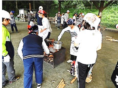
火おこし・カレー作り体験