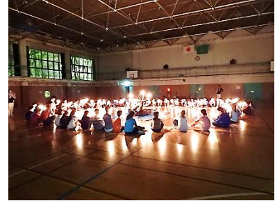
キャンドルファイヤーと勾玉作り体験