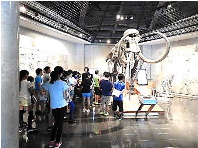
岩宿博物館見学と狩り体験

8月30日(木)～31日(金)は、6年生のチャレンジスクールでした。豊かな自然の中でのいろいろな活動に自分たちで挑戦し、乗り越えていく経験を通して、生活体験の幅を広げ、たくましさや豊かな心の育成を図る機会として毎年実施しています。初日の午前中に岩宿博物館へ行き、午後から国立赤城青少年交流の家での活動でした。