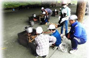
火おこし・カレー作り体験