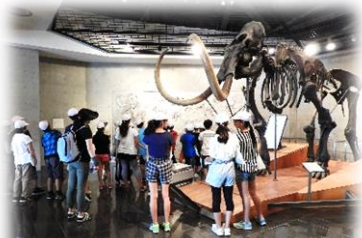
岩宿博物館見学と狩り体験

2学期が始まって間もない8月30日(水)～31日(木)は、岩宿博物館と赤城青少年交流の家で6年生がチャレンジスクールを行いました。豊かな自然の中でのいろいろな活動に自分たちで挑戦し、乗り越えていく経験を通して、生活体験の幅を広げ、たくましさや豊かな心の育成を図ることがねらいです。