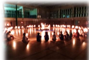
キャンドルファイヤーと勾玉作り体験