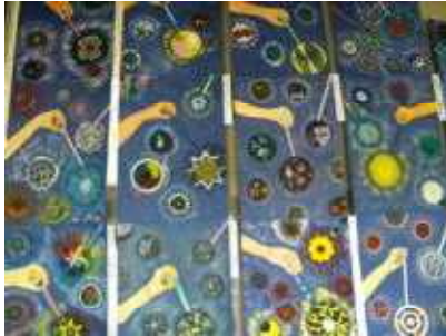
5年生「こんな花火あったらいいな」