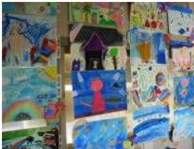
2年生「ふしぎなたまご」