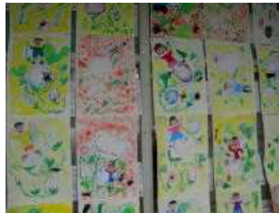
1年生「アサガオの国」

二者面談、大変お世話になりました。今年度、保護者の皆様ときちんとお話しできる時間がなかなかとれず、申し訳ありませんでした。短い時間でしたが、お子さんの様子や今後のことについて、保護者の皆様とお話しできたことは、学校にとりましては大変意義深いこと