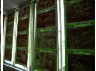
3年生「虫とぼく・虫とわたし」(版画作品)