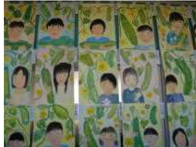
4年生「ぼくとヘチマ・わたしとヘチマ」