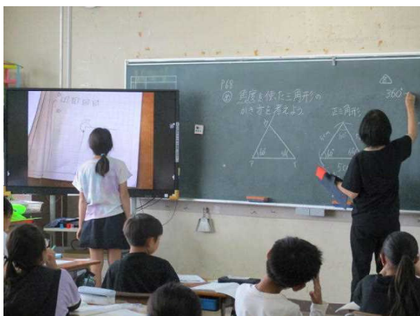
めあて[角度を使った三角形のかき方を考えよう]

一番大切なのは、「この時間は何をするのか」を理解して取り組むことです。先生方は授業で「めあて」を示します。例えば「〇〇の計算の仕方を考える」「〇〇を調べて、△△との関係を考える」などです。子供たちは、この時間にすることをしっかりと理解して、自分で考えたり、みんなで考えたりしながら調べて（追究して）いきます。最後に分かったことを「まとめ」とします。ぜひ「めあて」を意識して毎時間授業に取り組みましょう。「めあてをつかむ」→「調べる（自分で、みんなで）」→「まとめる・振り返る」という流れが基本です。中学校でもこの学び方が生きていきます。