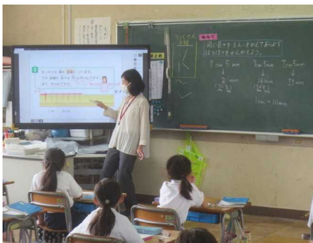
めあて[同じ長さを単位を変えて表す方法を考えよう]