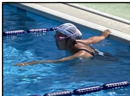
50m 自由形 ○さん