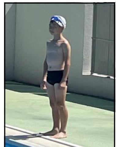
50m 背泳ぎ ○○くん