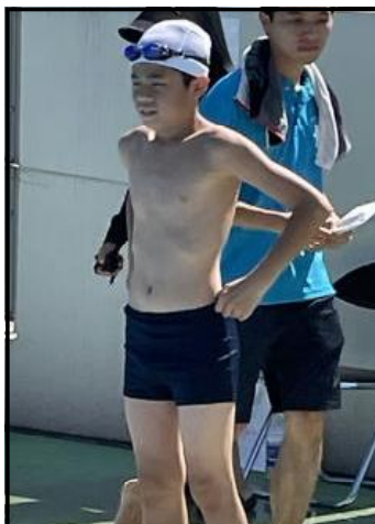
50m 自由形 ○○くん