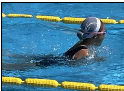
50m 平泳ぎ ○○さん