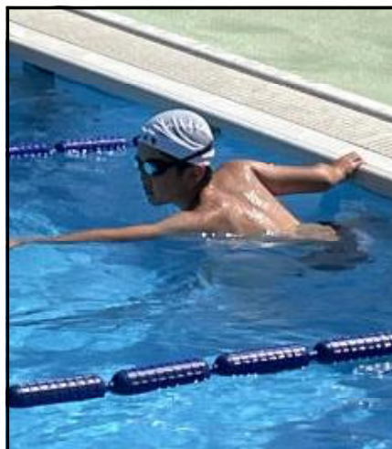
50m 自由形 ○○くん