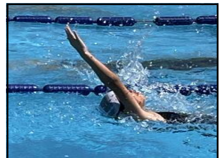
50m 背泳ぎ ○○○さん