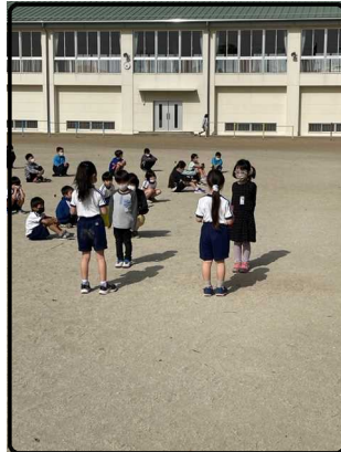
2年生から種のプレゼント