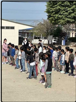
自分の名前を言うことができました

児童会本部が進行する中、1年生を迎える会を行いました。児童会副会長の迎える言葉や2年生からのアサガオの種のプレゼントがありました。短い時間でしたが、温かな時間となりました。