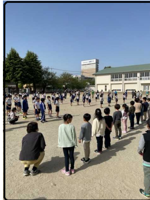
一緒に校歌を歌いました