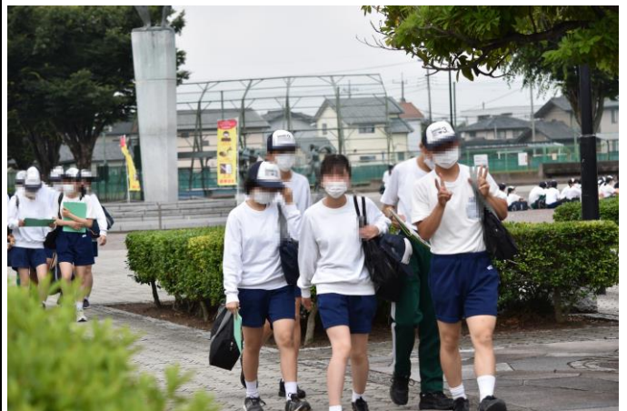
いざ、出発！うまくいくかな？