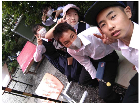
【自撮りの代償～消しゴムマジックで消してやるのさ～】