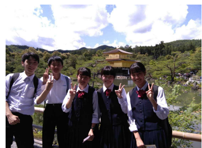
6組2班 【笑顔で撮った金閣寺】