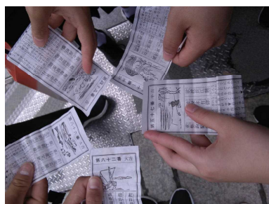
3組4班 【気分は大吉～強運な男達～】