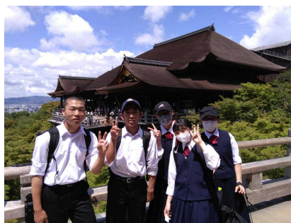
【最高の思い出 修学旅行】

「志望校全員合格という願いを叶えるために、キヨミズボールを集めることを決意した5人組。七星球を清水寺で見つけ、神龍を呼び出した！！果たして願いは叶えられるのか！？次回、出でよ神龍！叶える願いは誰のもの！？」