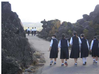
鬼押し出し園でけっこう歩きました