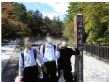
西の河原に来ました