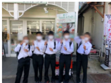
おみくじ買いました。

修学旅行の代替え行事として計画していた「草津旅行」に無事に行ってくる事ができました。現地では子供達が楽しそうに活動する姿を見ることができ、この旅行が実現できて本当によかったと思いました。これも保護者の皆様のご理解とご協力のおかげです。有り難うございました。