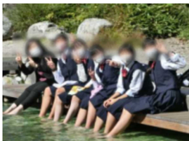
西の河原で足湯です