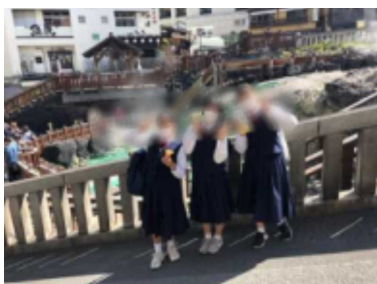
湯畑の前で買い物中に撮影