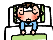
試験が受けられない

テストはこのようなことの練習の場でもあるということ意識してもらいたいと思います。本番入試できちんと出来ていなければ、受験出来なかったり、高校の先生に悪い印象を与えたり、自分の力を発揮できません。今から意識しておかなければならない大切なことです。27日、28日にも第3回復習テストが行われます。このことを意識して、準備をし、高い意識でテストに臨んでもらいたいと思います。