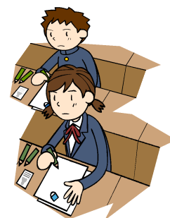
きちんとした服装と態度で試験を受ける

テストはこのようなことの練習の場でもあるということ意識してもらいたいと思います。本番入試できちんと出来ていなければ、受験出来なかったり、高校の先生に悪い印象を与えたり、自分の力を発揮できません。今から意識しておかなければならない大切なことです。27日、28日にも第3回復習テストが行われます。このことを意識して、準備をし、高い意識でテストに臨んでもらいたいと思います。