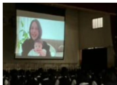
【転出された先生方からのビデオメッセージ】