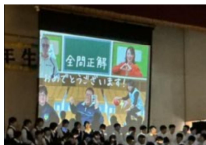
【2年生による出し物】