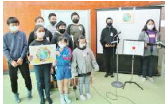
↑みんなで協力して発表をがんばりました！

ベトナム語 も日曜以外は曜日を順番で表しています。 日曜(chủ nhật チューニャット 神の日) 月曜(thứ hai / thứ 2 トゥーハイ 2番目) 火曜(thứ ba / thứ 3 トゥーバー 3番目)・・・