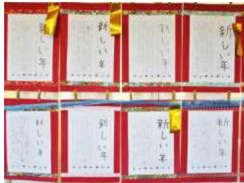
2年生 硬筆「新しい年」