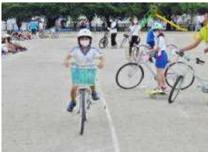
慎重にこぎ出す4年生