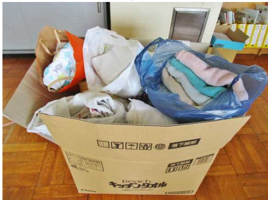
ダンボールいっぱいになりました

坂東太郎6号で、暴風雨による校舎内への雨の吹き込みや雨漏り対策用に古タオルの寄付をお願いしたところ、たくさんのご家庭から古タオルが届きました。直ぐにご協力いただき、大変ありがとうございます。これからバケツとセットにして各階に配備したいと思います。