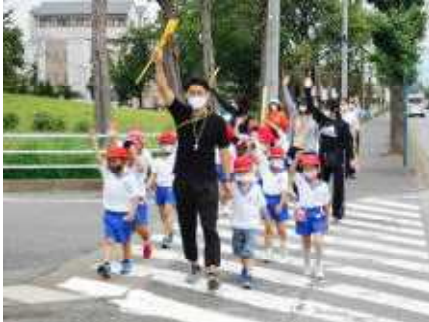
しっかり注意を守って歩く1年生

7月3日に、1年生と4年生を対象に本来なら4月に行う交通安全教室を実施しました。休校による授業時数減により、いろいろな学校行事等が中止になる中ですが、これは子供たちの安全啓発に欠かせない内容ですので、約2か月遅れでしたが実施しました。