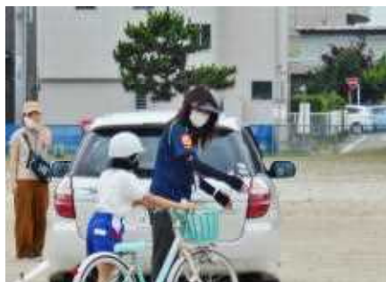
車のわきを通るときは…