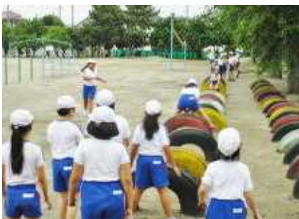
軽スポーツクラブ