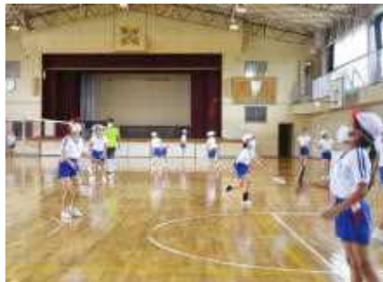
球技(体育館)クラブ(バドミントン)