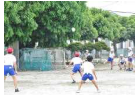
球技(校庭)クラブ(フットベースボール)