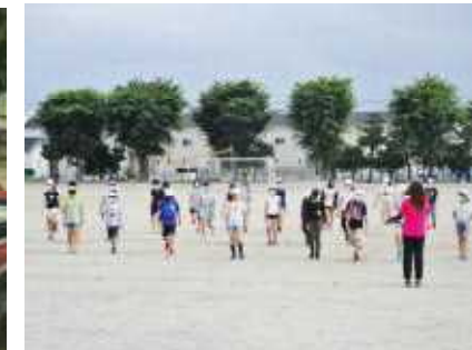
金管バンドクラブ

※写真では紹介できませんでしたが、他にボードゲームクラブと習字クラブがあります。