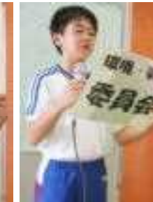
環境・美化委員会