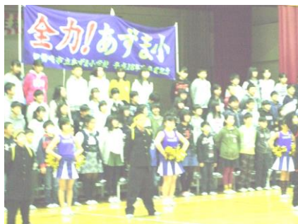
6 年生「後輩に教えようプロジェクト」最終回