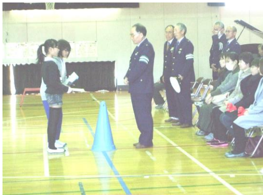
3 月 9 日 (木) ありがとう集会

この 1 年間あずま小学校の子どもたちは、たくさんのことを学び、大きく成長しました。1 年生は漢字を 80 文字も学びました。2 年生はかけ算九九をしっかりとマスターしました。仲間と協力し合い、多くのことを成し遂げました。子どもたち一人一人が頑張りました。そして、多くの人たちに支えられました。友達、先生、家族、地域の方々、たくさんの人に愛情を持って支えられ、成長しました。子どもたちは今、自分の成長を振り返り、多くの人たちの支えに感謝の心を持って 1 年の終わりを迎えています。本年度も、あずま小学校の教育活動にご理解・ご協力をいただき、ありがとうございました。