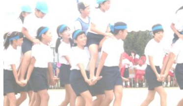
大好評騎馬ぼうし取り

9月24日(土)に第106回運動会が開催されました。雨が心配されたため、午前中に全種目を行いました。多くのご来賓、保護者、地域の方においでいただき、子供たちの頑張る姿を見ていただきました。温かな応援ありがとうございました。子どもたちは全力で走り抜き、団競技ではみんなで力を合わせ、表現では体全体で思い切り演技しました。係の高学年の子どもたちもしっかり運営に参加できました。一人一人の笑顔が輝いていました。各団長の下、応援合戦も熱くすばらしかったです。運動会をとおして、子どもたち一人一人が、そして集団として大きな成長を見せてくれました。