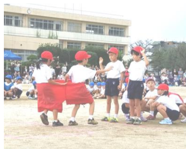
かわいいデカパンリレー