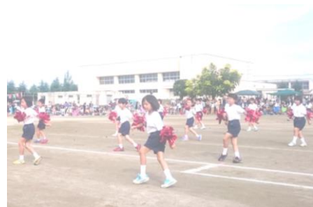
のりのりポッキーダンス