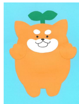
新登場 成年の しばずちゃん