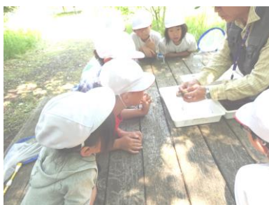
5 / 1 9 3年生昆虫の森