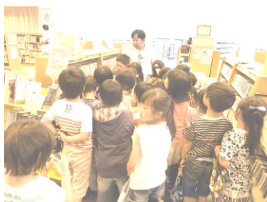
6 / 2 2年生あずま図書館