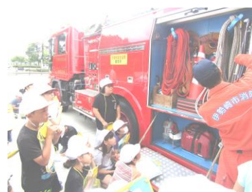
6 / 6 4年生消防署