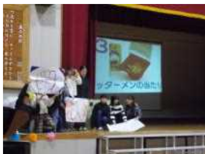
5年生は、6年生の臨海学校や修学旅行中のエピソードをクイズ形式で発表しました。盛り上がりました。

ちがとてもよく伝わってきました。また、6年生も「さすが最上級生」と思わせてくれる立派な歌と呼びかけを披露してくれました。6年生が卒業してしまうのはとても寂しいですが、あずま小を去っても、私たちがここで応援していることを忘れないでほしいと思いました。