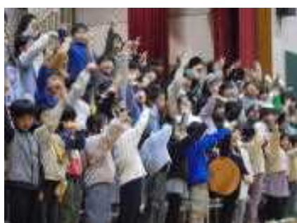
2年生は劇と「にじ」を披露。