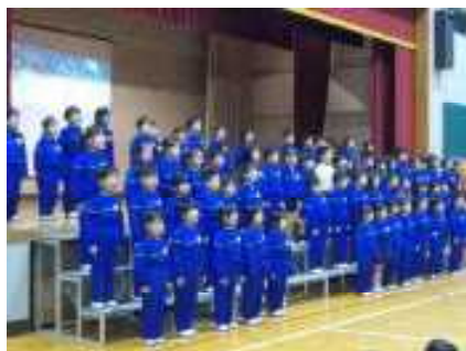
1年生の発表の様子。国語で学んだ「くじらぐも」をアレンジした呼びかけと歌を披露。

2月25日(水)2～4校時で体育館において「6年生を送る会」を行いました。5年生が進行する中、6年生が、1年生と手をつないで入場しました。その後、1年生手作りのペンダントが6年生にプレゼントされ、各学年の児童たちと職員が、これまで練習を重ねてきた歌や劇、呼びかけ等を心を込めて発表しました。そこから、6年生をお祝いする気持ちとともに、6年生に感謝する気持