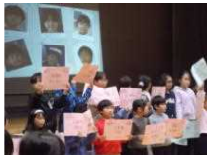
4年生のスライドショー。1年生の時の懐かしい写真に笑顔が。

ちがとてもよく伝わってきました。また、6年生も「さすが最上級生」と思わせてくれる立派な歌と呼びかけを披露してくれました。6年生が卒業してしまうのはとても寂しいですが、あずま小を去っても、私たちがここで応援していることを忘れないでほしいと思いました。