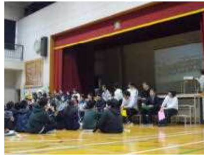
職員もスライドと歌を披露。