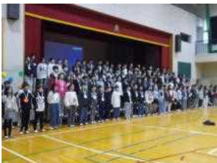
6年生のお礼の歌と呼びかけ。