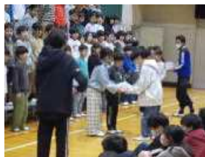
3年生から6年生へ、顔写真入りうちわのプレゼント。

2月25日(水)2～4校時で体育館において「6年生を送る会」を行いました。5年生が進行する中、6年生が、1年生と手をつないで入場しました。その後、1年生手作りのペンダントが6年生にプレゼントされ、各学年の児童たちと職員が、これまで練習を重ねてきた歌や劇、呼びかけ等を心を込めて発表しました。そこから、6年生をお祝いする気持ちとともに、6年生に感謝する気持