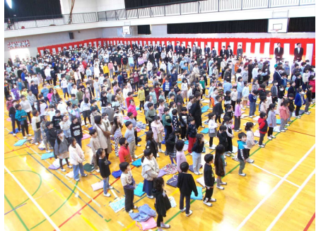
翌日上毛新聞掲載→

今後も児童全員が本校の教育スローガンである「未来の自分のためにチャレンジ」していき、あずま小学校にさらに輝く歴史を積み上げていくことができるよう願っています。本式典の開催に当たり、これまでご尽力をいただきました実行委員会の皆様へ感謝申し上げます。