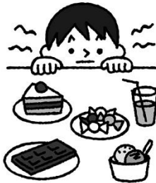
甘い物を食べすぎない