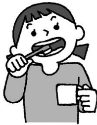
食後の歯みがきが基本