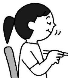
しっかりかんでゆっくり食べる