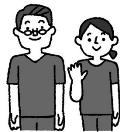
定期的に歯科検診を

学校では給食を食べ終わったら5分間歯みがきをしていますね。実は歯みがきをすると口の中の悪い菌が少なくなるので感染症予防になります。病気になりにくい体になるために、しっかり歯みがきをしましょう。