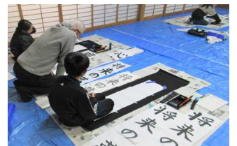
文字の配置の確認