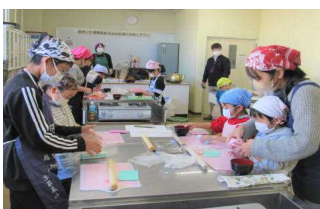
デコもち作りの様子

これからも公民館等の公開講座や、地区の行事に積極的に参加し、様々な体験をしてほしいと思います。