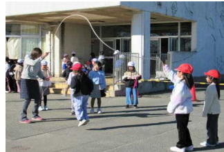
長縄跳びも楽しいよ!