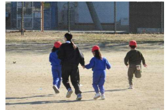
みんなで追いかけて

♪寒さに負けず、児童も、先生も、みんな元気です!(1月9日(金)昼休みの風景)♪