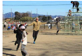
先生! 足が速いです!