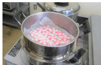
できあがったデコもち