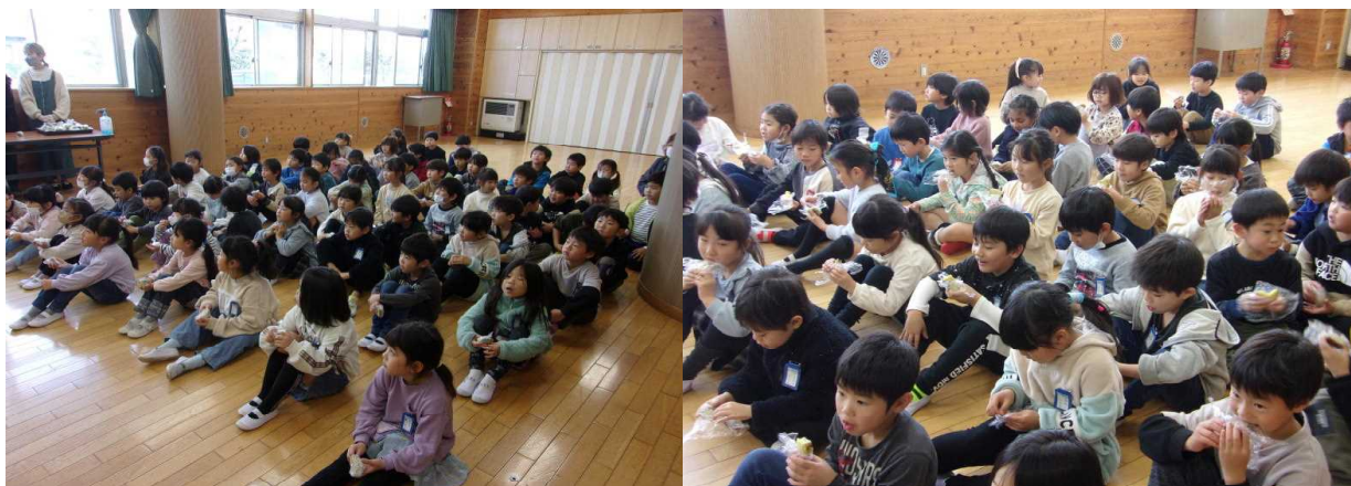
(これからお芋を食べます)

1年生は、学校菜園でサツマイモを育ててきました。暑い夏の日も、水をやる世話を続けて、成長したサツマイモを事前に収穫しました。収穫したサツマイモを、「いもいもパーティー」でごちそうになります。12月12日（火）にボランティアの保護者の方に協力していただいて、子供たちが、食べやすい大きさに調理していただきました。いもいもパーティーは、3時間目に多目的室で行いました。みんなで食べたサツマイモは、とてもおいしかったです。「甘くておいしい!」「なつかしい味だあ」と子供たちは歓声をあげながら、喜んで食べていました。自分たちで育てたものですから、最高の笑顔で食べていました。ボランティアで参加された保護者の皆様、たいへんありがとうございました。