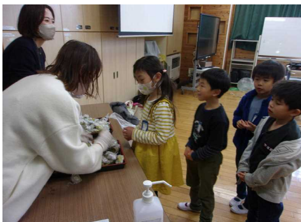
(たくさん、いただきましょう)