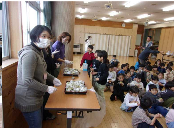
(とても、おいしかったです)