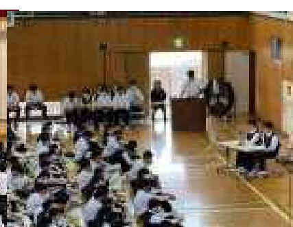
進行役の生徒会本部