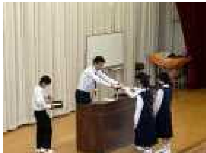
各クラスの署名の提出