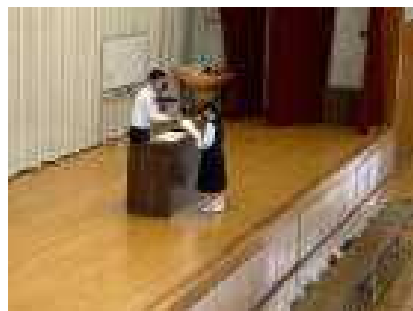
福祉委員長に続き、全校生徒で「誓いの言葉」