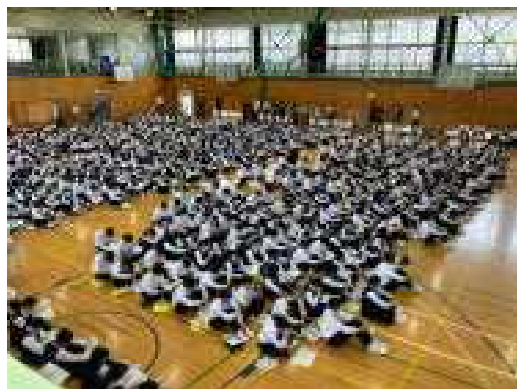
一堂に会した全校生徒

引き続いてのJRC登録式も、全校生徒が一斉に「誓いの言葉」を言うことができました。