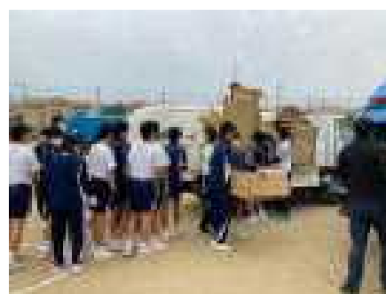
学校に集められた古紙をパッカー車に積み込みます