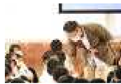
生徒とのやりとりも