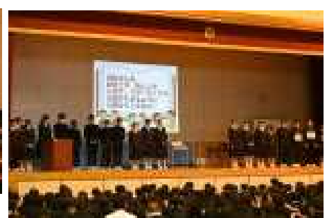
頑張ってくれた保健委員のみなさん