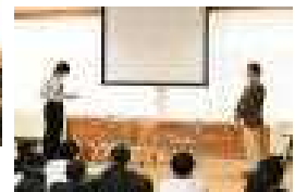
生徒代表お礼の言葉

続く12月1日(金)には、5・6校時を使って学校保健委員会が行われました。まず全校生徒が体育館に集まり、保健委員が行うアサーション(自分も相手も大事にして、より良い結論に導くコミュニケーション方法のこと)に関する発表を聞き、その後は学年毎に分かれてロールプレイをしたりワークシートに記入したりしました。この日のために、保健委員は10月から準備を重ねてきました。