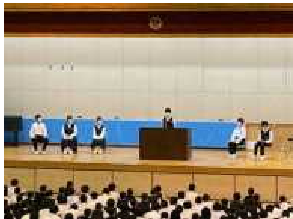
学年代表の生徒のみなさん

6月2日（金）の第6校時に、本校体育館において、校内少年の主張大会が開かれました。各学年から2名ずつ選ばれた合計6人の生徒が、全校生徒と教職員合わせて約850人の前で意見発表を行いました。どの主張も素晴らしく、発表する態度も堂々とした立派なもので、審査にも大変時間がかかりました。また発表後の意見交流会でも、生徒の中から積極的に挙手して感想を述べる様子が見られ、とても充実した大会になりました。