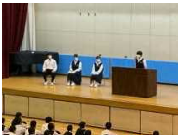
壇上でも他者の発表に耳を傾けます