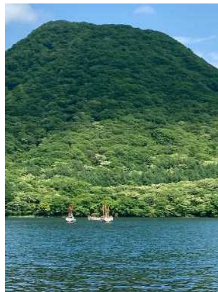
榛名富士に向け「櫂立て!」