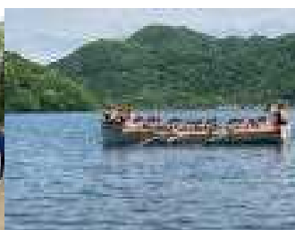
午後から天気も回復し、湖面の風も爽やか