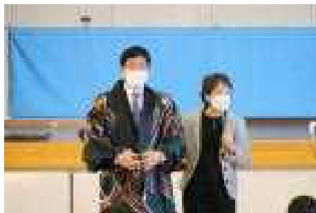
校長先生も モデルに