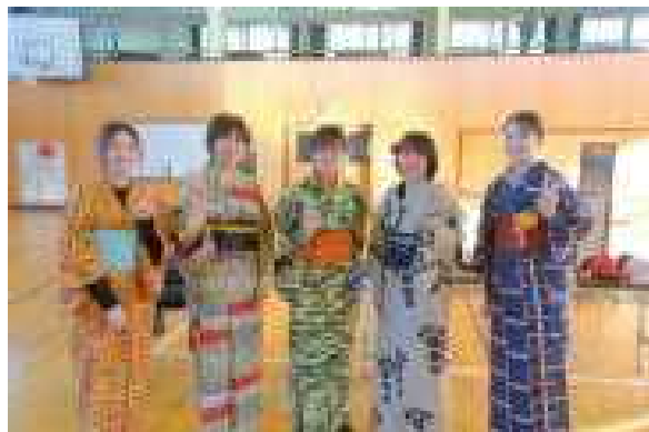
「先生たち、いつもと違う！！」