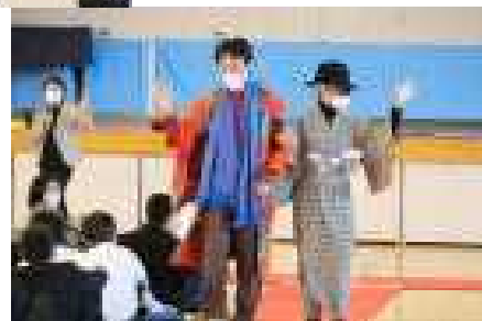
現代風のアレンジ