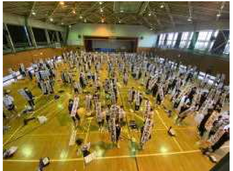
みんなの作品を見せて！