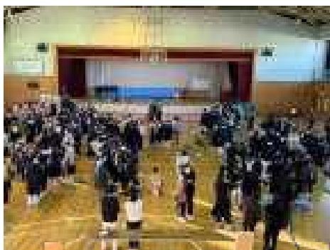
ランウェイを歩き 気分はTGC!?