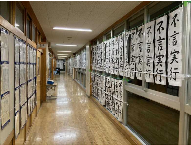
作品は1年の廊下に掲示されました