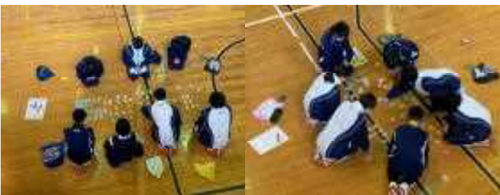
並び方は、班それぞれ

1月16日(月)の5校時には、1年生の百人一首大会が行われました。目の前にある札を静かに取る生徒、読み上げられる最初の数字で札を取る生徒など、様々な姿が見られました。