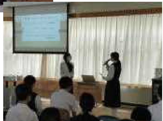
お礼の言葉も礼儀正しく