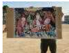
恒例のお見送りボード三猿 ver.

8日(水)には1年が榛名高原学校に、そして10月には、3年生が修学旅行に出かけます。