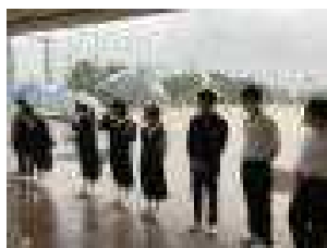
晴れの日も 雨の日も