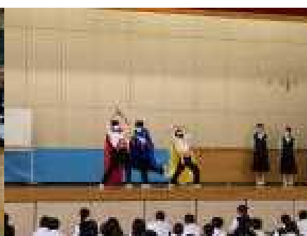
恒例のAZMレンジャー