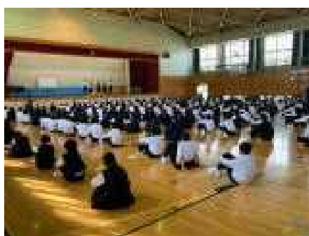
1年生は間隔をとって聞きます