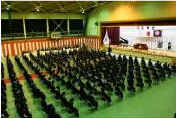
246名の新入生を迎えて