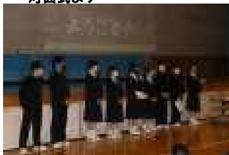
進行する生徒会本部役員