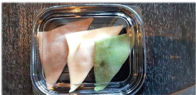
↑「これは売れるな」と思うほど上手な出来栄です。(生徒作品) ハツ橋作り体験より

3日間の楽しかった修学旅行が終わってしまいました。それぞれのクラスや各班が長い時間をかけて計画をし、たくさんの思い出を作って帰ってきたと思います。