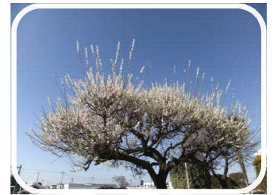
空高く伸びる枝 咲いた静かな梅