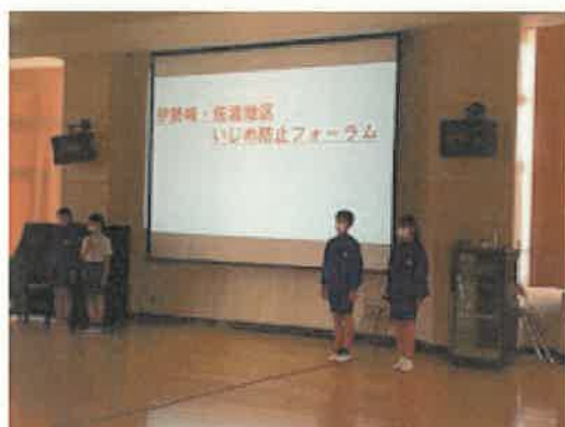
発表前はやや緊張

12月9日（水）モジュールの時間に、学級委員会の児童が「伊勢崎・佐波地区いじめ防止フォーラム」の報告会を実施し、「これからのネット社会をよりよく生きていくために、そして、いじめのない赤堀東小をつくるために、自分たちにできること」を考え、発表しました。