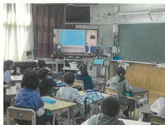
各クラスにZOOM配信 みんな真剣に聞いています。

大人の私たちが未だかつて経験したことのない情報化社会、その中を子どもたちは生きていきます。ひとり一人が自分ごととして考えることが大切です。