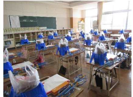
課題配布準備を終えた1年生の教室→

今回配布した課題には、新学年で学ぶ内容が含まれています。お子さんが課題に取り組む際は、ぜひ励ましの言葉をかけてあげてください。学校が再開されましたら、その内容に関する補充学習を行います。