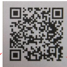
あたらしいさんすう