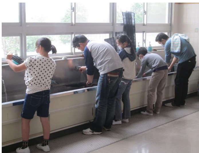
↑ 保護者が協力して作業