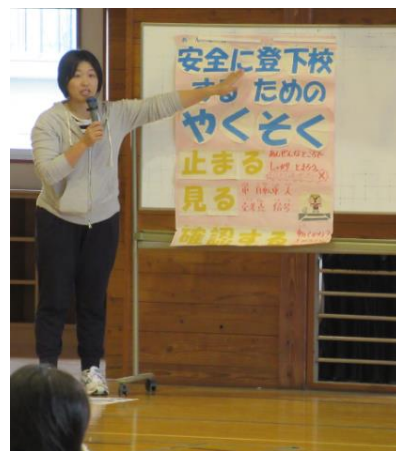
交通安全担当からの講話

交通安全については学校でも繰り返し指導していますが、今回改めて担当から全校児童に向けて話をしました。ご家庭においても引き続き安全な歩き方及び自転車の乗り方についてご指導のほどよろしくをお願いします。