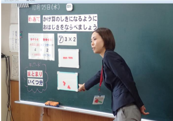
【 2年2組 算数「新しい計算を考えよう」 小泉教諭 】