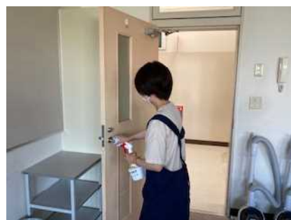
下校後の消毒 がんばります

今後もまだまだ消毒作業は必要と考えます。在庫が少なくなってきたため、地域の皆様に、ご家庭にある使用済みタオル等の寄付を再度お願いいたします。どうか、ご協力をよろしくお願いいたします。