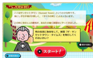
▲家庭での学習履歴が残ります