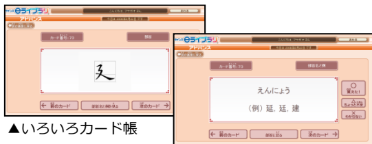
▲いろいろなカード帳

いろいろなカード帳やはやときチャレンジなど、楽しみながら学習するコンテンツもあります